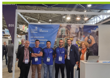
SIFA - 2022 @snefccca

Dans la continuité des actions menées en faveur de la promotion des métiers, le Snefccca a également signé une convention de partenariat avec la Société Nationale du Meilleur Ouvrier de France, organisme qui organise également la compétition du Meilleur Apprenti de France.