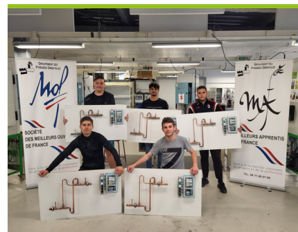
FINALE RÉGIONALE MAF 2022 @LP PABLO PICASSO PERPIGNAN

Afin de promouvoir la notoriété du métier, la Commission Formation s'est investie dans le soutien des compétitions professionnelles existantes, les Meilleurs Apprentis de France (MAF), et surtout les finales régionales WorldSkills, qui aboutiront en 2023 à la finale nationale à Lyon.