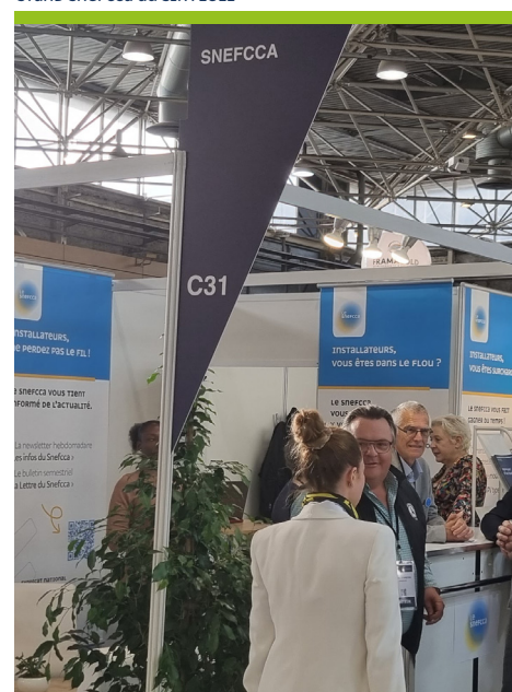
STAND SNEFCCA AU SIFA 2022