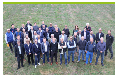
RÉUNION RÉGION BRETAGNE - 2022 @LP ST-JOSEPH LORIENT